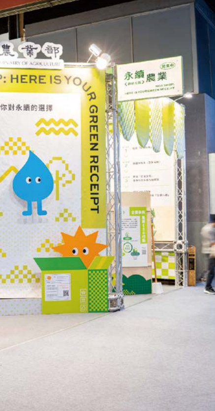
歡迎光臨，永續農業營業中。

場以「販賣所」為創意概念，將購物語彙與消費場景轉化為永續教育的體驗媒介，讓觀展民眾透過「買」與「選」的互動，重新思考日常消費與農業永續之間的關聯。從農業政策的推動、產業轉型的努力，到消費者行為的改變，策展設計引領觀眾走進一場從田間、超市到餐桌的永續旅程，體驗每一個消費選擇背後的环境影響與社會價值。