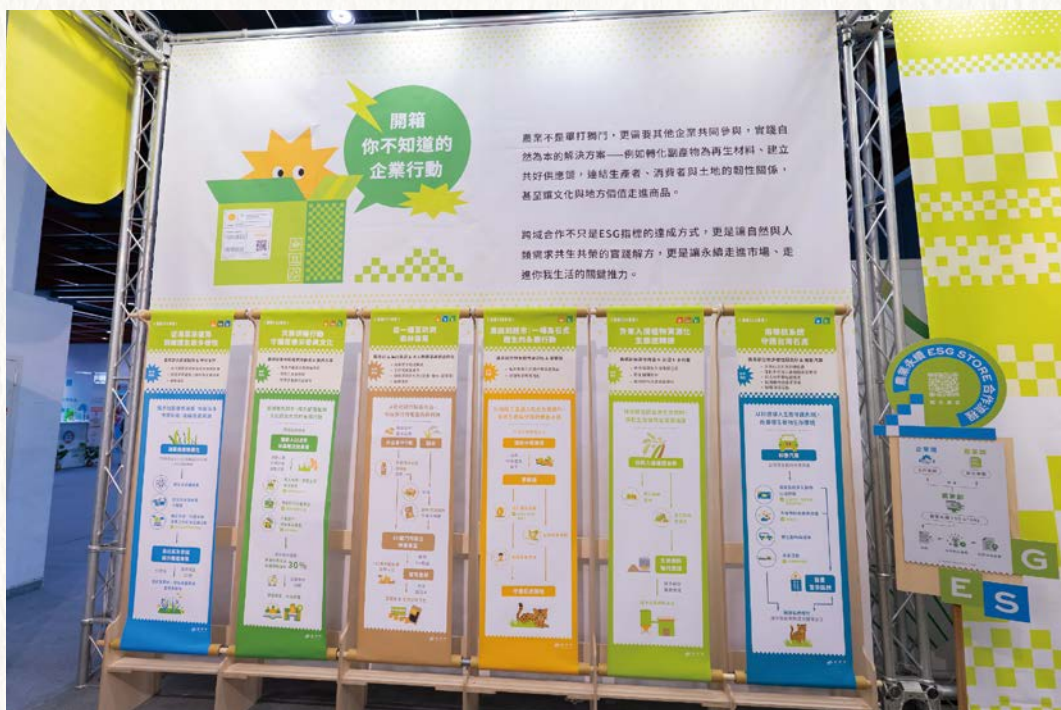
企業案例區 - 農業永續 ESG 成果分享。