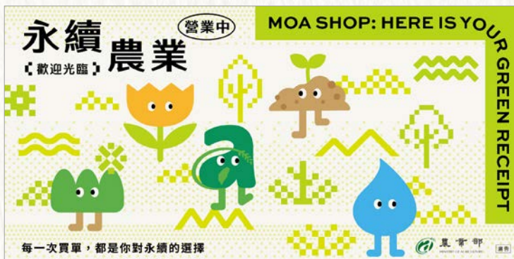
農業元素主視覺，代表土壤、森林、花卉、水及農業部視覺意象。

此次展區精心規劃5款視覺角色，各自代表農業重要元素，包括：土壤、森林、花卉、水及農業部視覺意象；不同角色也呼應不同的永續性格，例如：溫暖的土壤代表著可靠踏實的永續性格，重視在地生產的商品且不過度消費，是個負責任的踏實主義者。