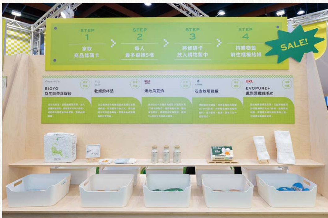
農業永續商品體驗區。