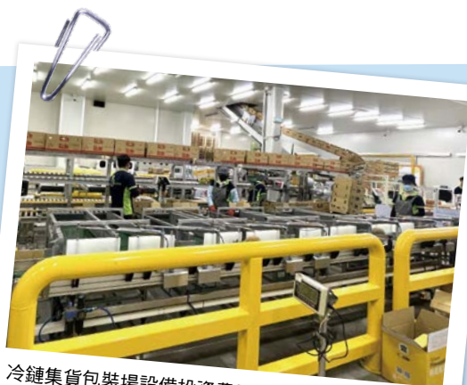
冷鏈集貨包裝場設備投資費用可觀，需充分了解產品特性與設備性能，建立妥善的應用技術。

在外銷包裝場端，冷鏈設備的投資費用相當可觀，包含：廠房、作業場域隔間、冷藏庫、預冷設備、自動化及監測系統等。且除了初期的設備投資以外，還需面對長期的電費支出、維護成本、人員僱用與設備故障風險，一旦設備或供電發生異常，便會嚴重影響集貨包裝廠的作業進度，並造成交貨期違約