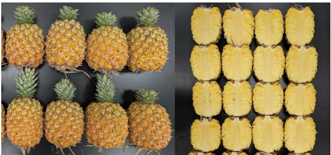
鳳梨‘台農23號’（芒果鳳梨）較耐低溫貯運，經模擬貯運21天後模擬常溫樹架2天，少有寒害徵狀發生。

此外，鳳梨田間採收成熟度主要靠果皮轉色程度來判斷，佐以品管人員糖度測量及口感品評意見回饋。過低的成熟度可能使果實對低溫更為敏感，因此正確的評估採收成熟度，為外銷品質規範與管理上至為關鍵的一環。