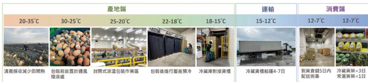
漸進式降溫策略之各階段果實目標溫度

過去在談到壓差預冷的應用時，許多人會問，壓差預冷的降溫速度有多快？可以在幾分鐘讓果實降到貯運設定溫度13度？然而預冷的主要目的，是移除田間熱以減緩代謝速率，而非單純追求快速且大幅度的降溫。鳳梨在田間經過陽光曝曬，高溫季節果溫常高達40°C以上，若果實包裝後直接裝滿冷藏庫，或是直接裝填貨櫃，可能無法順利降溫，使產品失水或病害加劇。因此，在進入冷藏貨櫃前，需要先移除田間熱，以減緩採收後產品的失水及老化，這便是預冷的目的。